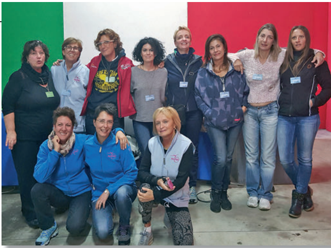
Il gruppo FlyPink alla riunione di Pavullo

Un grandissimo divertimento! Sono innamorata del volo, soltanto sollevare la ruota da terra mi fa immediatamente sentire a mio agio. Volare sulle Alpi, poi, è come volare in una cattedrale naturale, tutto assume un sapore magico. Quei panorami mozzafiato, quei ghiacciai, quei cumuli a perdita d'occhio, le aquile, le Dolomiti con la loro maestosità ti ripagano delle grandi fatiche anche fisiche, ti riscaldano da freddi così intensi e ti consolano da quelle delusioni spesso dietro l'angolo.