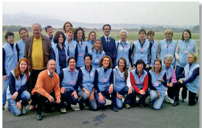
Un raduno FlyPink a Varese

Nel Marzo 2006 organizza il meeting "Volo a Vela in Rosa" durante il congresso nazionale annuale, nel tentativo di creare un gruppo femminile.