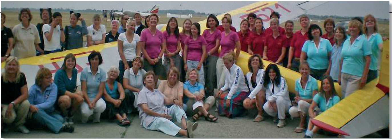
Le pilote che hanno preso parte a un recente campionato mondiale