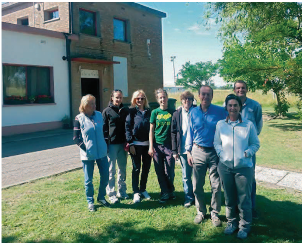
Foto di gruppo al completo davanti alle strutture del club volovelistico di Ferrara