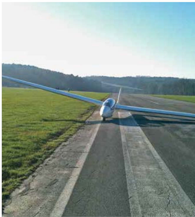
Atterraggio e rullaggio fino alla testata

“Sa, dottore”, gli dico, “viene anche chiamato volo silenzioso perché non c’è il rumore del motore, ma si sente il sibilo del vento, se impari ad ascoltare e ad osservare ti rivela tante cose. Ha mai visto il vento incresparsi l’acqua? Se guardi distrattamente vedi solo il ruvido che si forma sulla superficie, ma indica anche la direzione del vento e dove si appoggerà, così da poter usare la sua forza per volare. L’ho imparato qualche giorno fa volando, come ho imparato che l’aria è densa di energia, quella stessa che tiene su un aliante”.