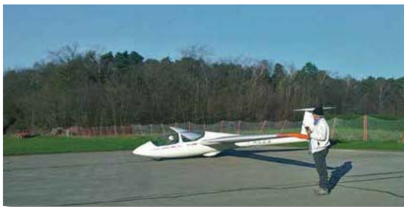
Il momento faticoso

Non è il medico aeronautico, ma proprio quello di base. Ormai è diventato un rito e devo dire anche piacevole. Visita medica per i miei controlli abituali, entro in studio, mi siedo... e tutte le volte la prima mezzora trascorre parlando di volo. Ancora non si capacita come fanno gli alianti a volare senza motore, mi fa tante domande e poi vuole sapere cosa provo.