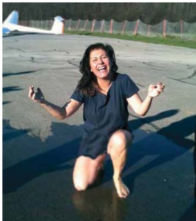
Il rituale della doccia per ogni pilota che vola da solo è stato applicato con rigore