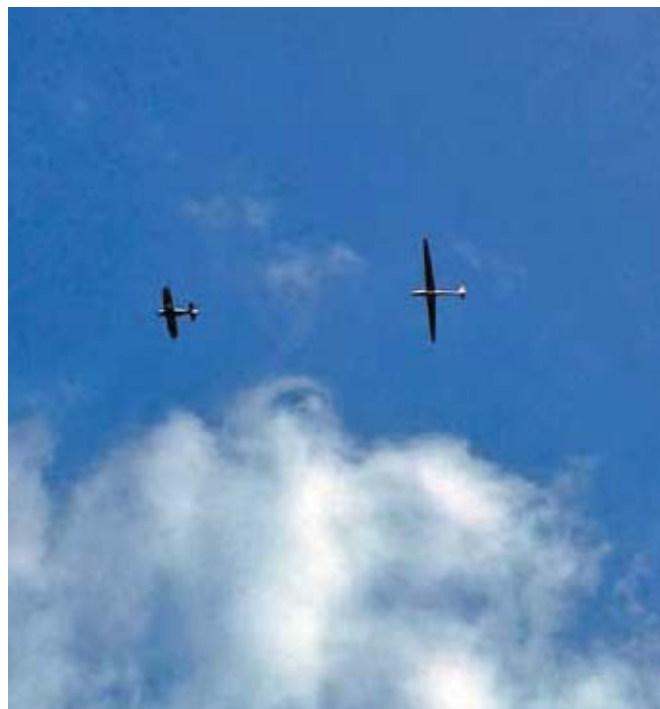
Tante macchine fotografiche hanno seguito il volo di Liana

Io: "Perché volare è il vertice della piramide dei sogni degli esseri umani, quindi perché mai iniziare dalla base?!" ■